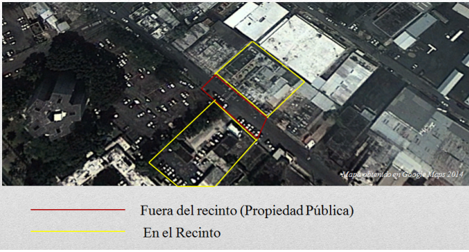
Recinto de San Juan